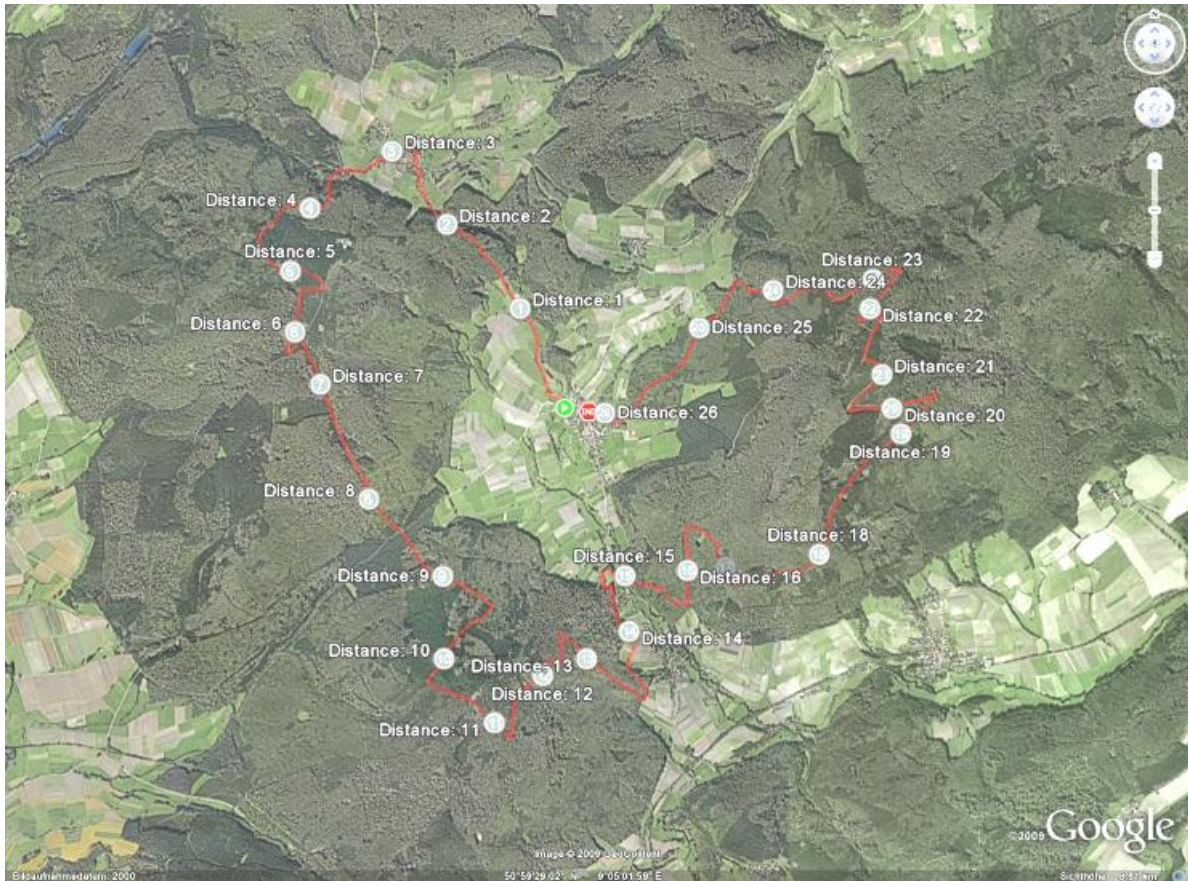
Die Laufstrecke in der Draufsicht