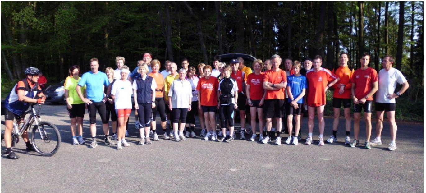
Die Teilnehmer auf dem Parkplatz Himmelsberg

Mit 32 Personen fiel die Beteiligung in diesem Jahr beim traditionellen Himmelsberglauf am Karfreitag zwar deutlich geringer aus wie in den Jahren davor, dafür zeigte sich allerdings das Wetter von seiner schönsten Seite. Wahrscheinlich war das schöne Sonnen-Wetter auch der Grund, warum viele der Stammläufer der vergangenen Jahre nicht anwesend waren, weil sie die Osterfeiertage für einen Kurzurlaub nutzen wollten. Wie man der Läufer-Info von Horst Diele entnehmen konnte, handelte es sich in diesem Jahr bereits um den 74. Himmelsberglauf, der seit 1971 regelmäßig durchgeführt wird.