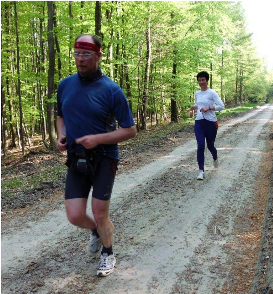
Bericht: Frank Dietrich